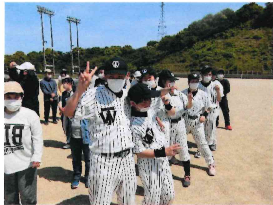
ソフトボール大会