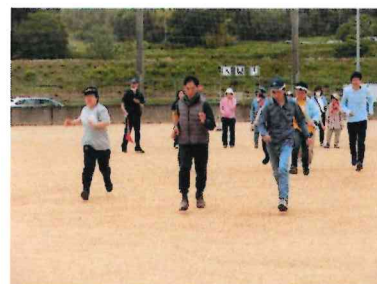
銀河の会 合同 運動会