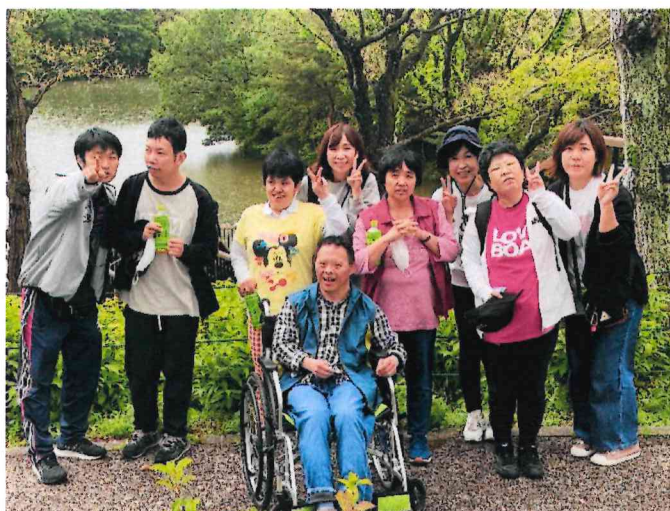
まんのう公園散策