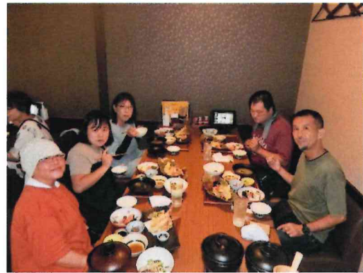
食事マナー（ごはんや えん）