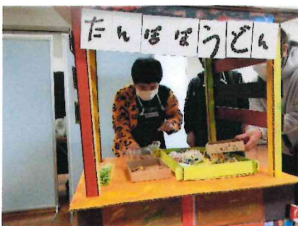
高松市アートリンク