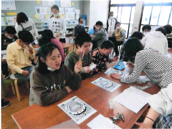
衛星指導（歯磨き指導）