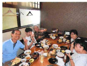
食事マナー（ごはんや えん）