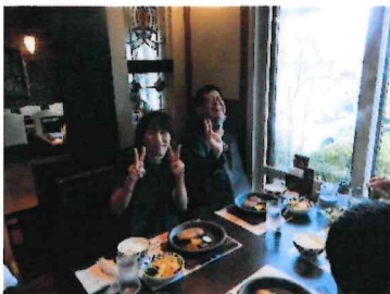
食事マナー（山のや）